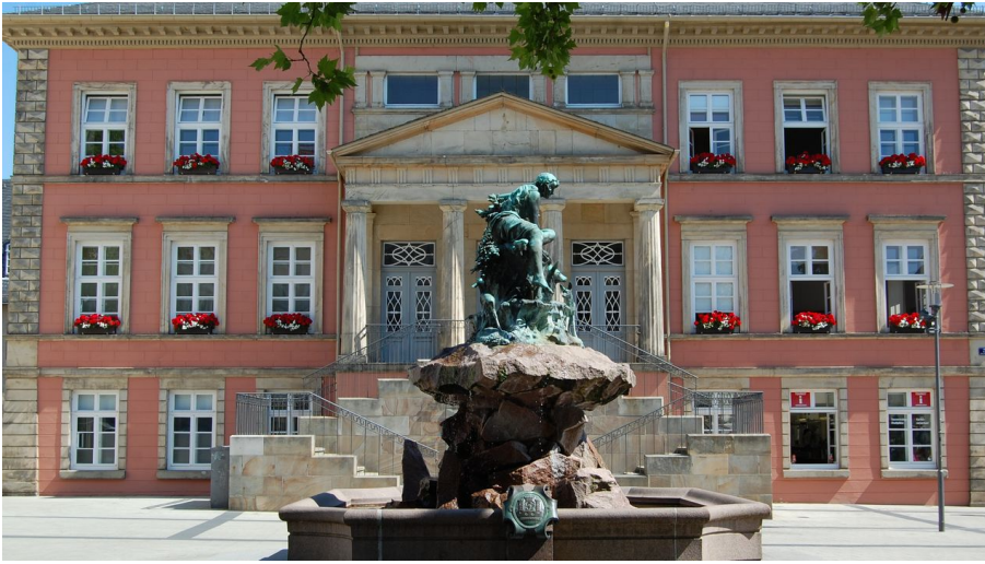
Donopbrunnen auf dem Detmolder Marktplatz