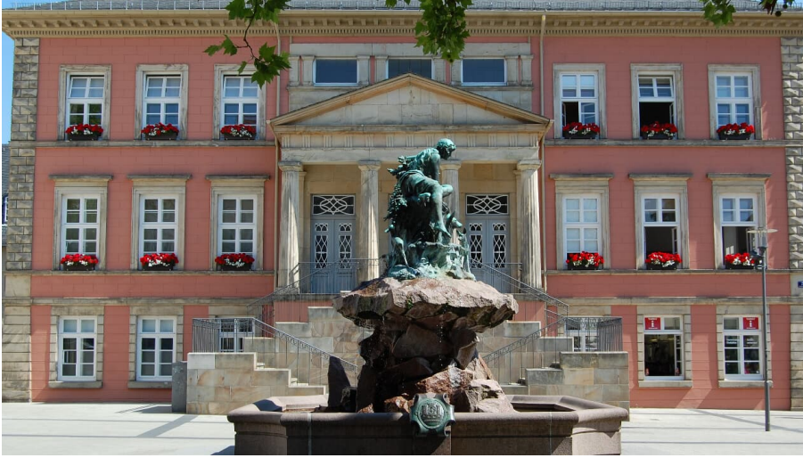
Donopbrunnen auf dem Detmolder Marktplatz