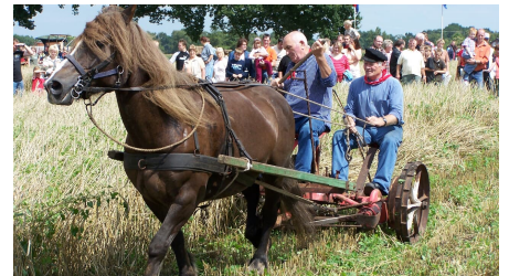
Aperberg Kornmähen