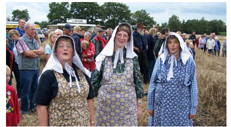
Alte Trachten