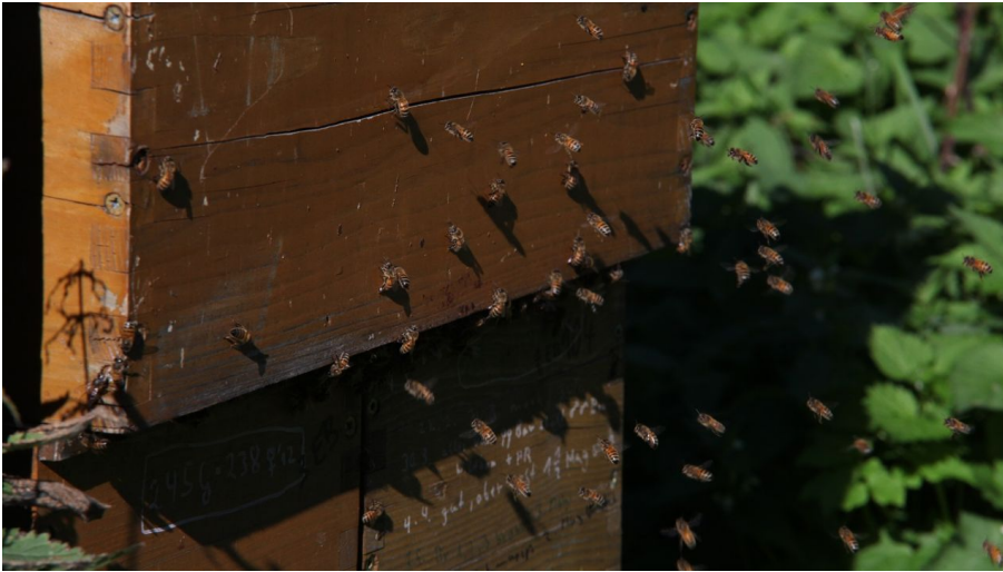
Kulturland Kreis Höxter, c/o GfW im Kreis Höxter mbH