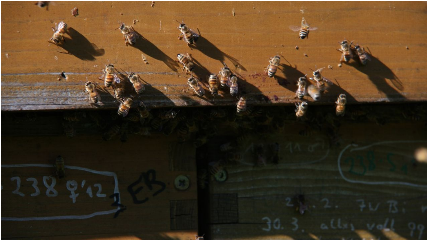
Kulturland Kreis Höxter, c/o GfW im Kreis Höxter mbH