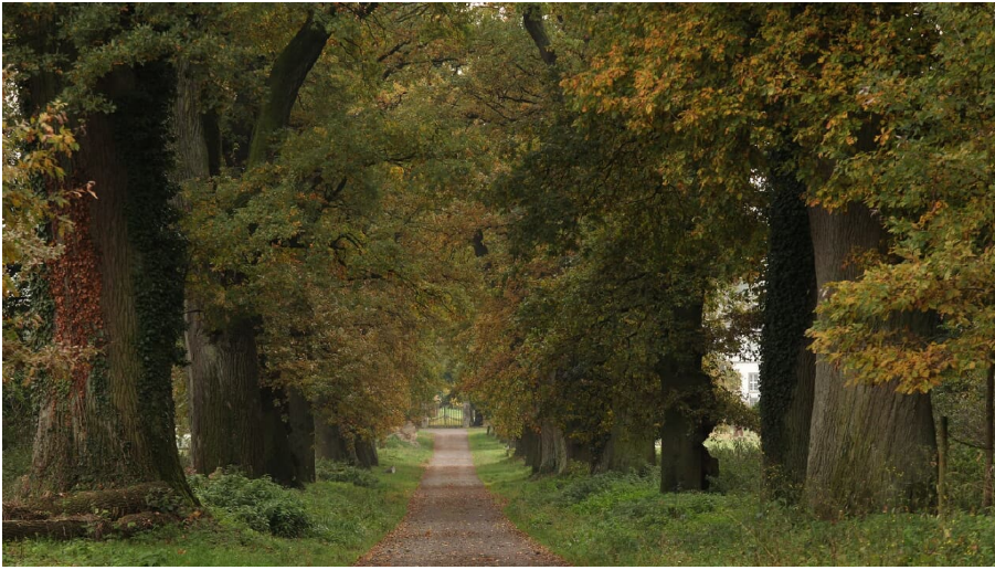
Kulturland Kreis Höxter, c/o GfW im Kreis Höxter mbH