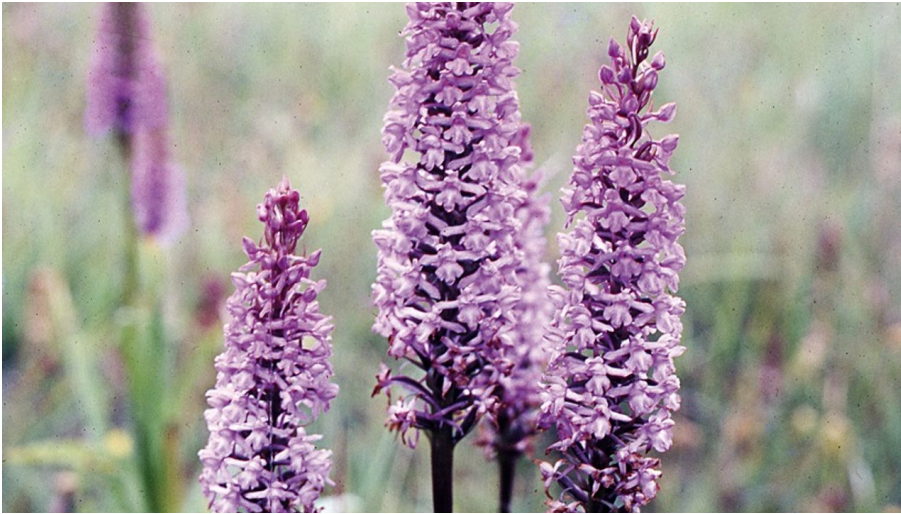
Orchideen im Naturschutzgebiet Wenkenberg