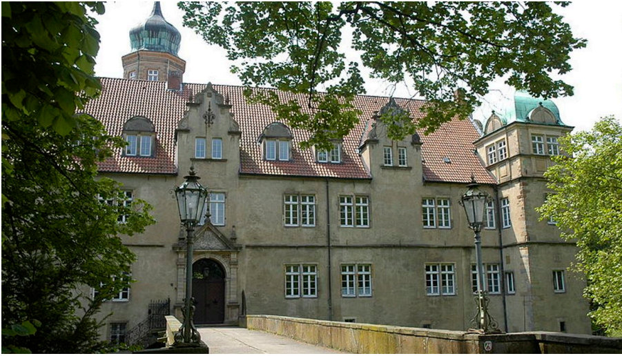
Wasserschloss Ulenburg