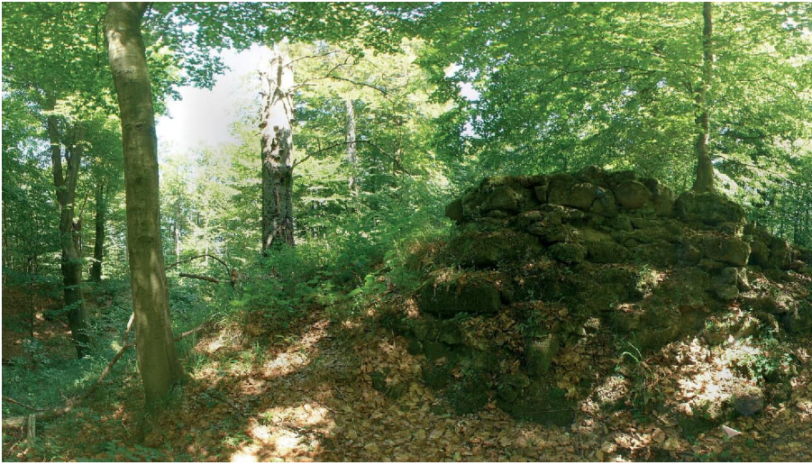
Stadtwüstung Blankenrode