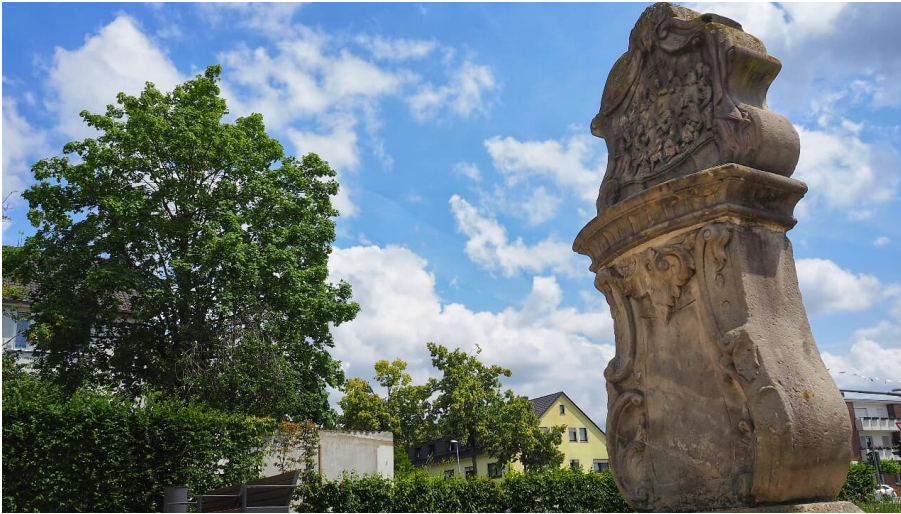
Apostelstein