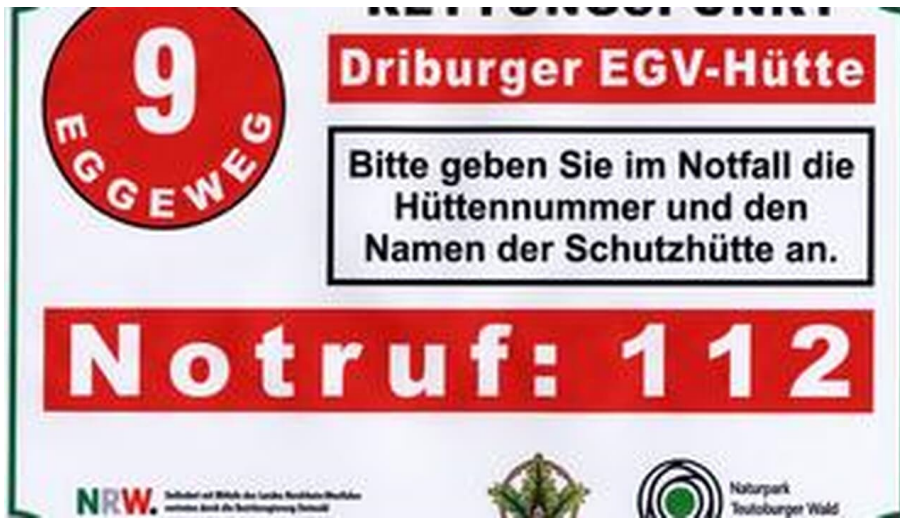
Radbaum Hütte (Rettungspunkt 12)