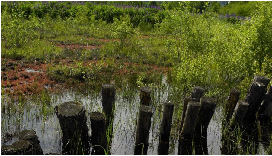
Moorteiche im Gräflichen Park