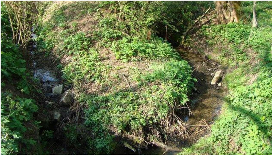
Bad Driburger Touristik GmbH