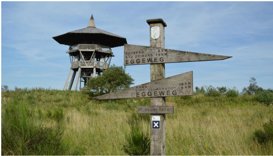
Eggeturm an der Preussischen Velmerstot - © Ina Bohlken, Teutoburger Wald Tourismus