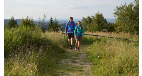
Wanderer am Preussischen Velmerstot, Hermannshöhen