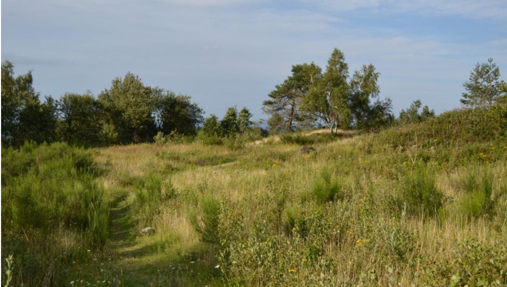
Bizarre Landschaft, Preussische Velmerstot - © Ina Bohlken, Projektbüro Hermannshöhen

Voor het laatst aangepast 29.08.2024, 17:55