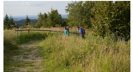
Naturbelassener Pfad an der Preussischen Velmerstot - © Ina Bohlken, Teutoburger Wald Tourismus