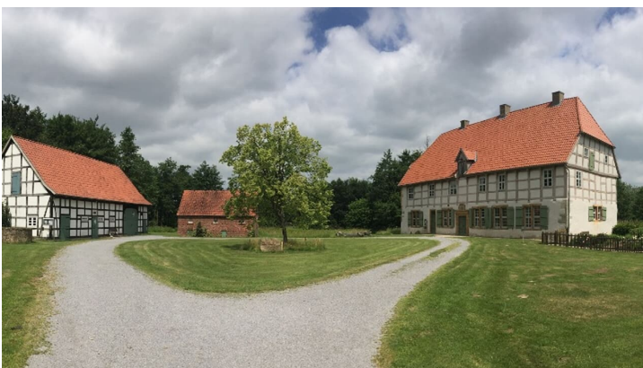
Werbburg - Ensemble