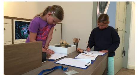
Werburg - Arbeit im Forscherlabor