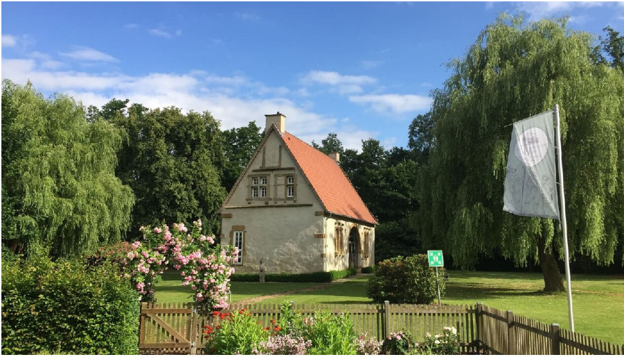
Werbung - Torhaus der Burganlage - © Werburch-Museum Spenge