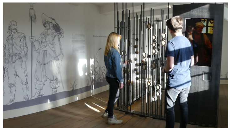
Werbburg - Blick in den Ausstellungsraum