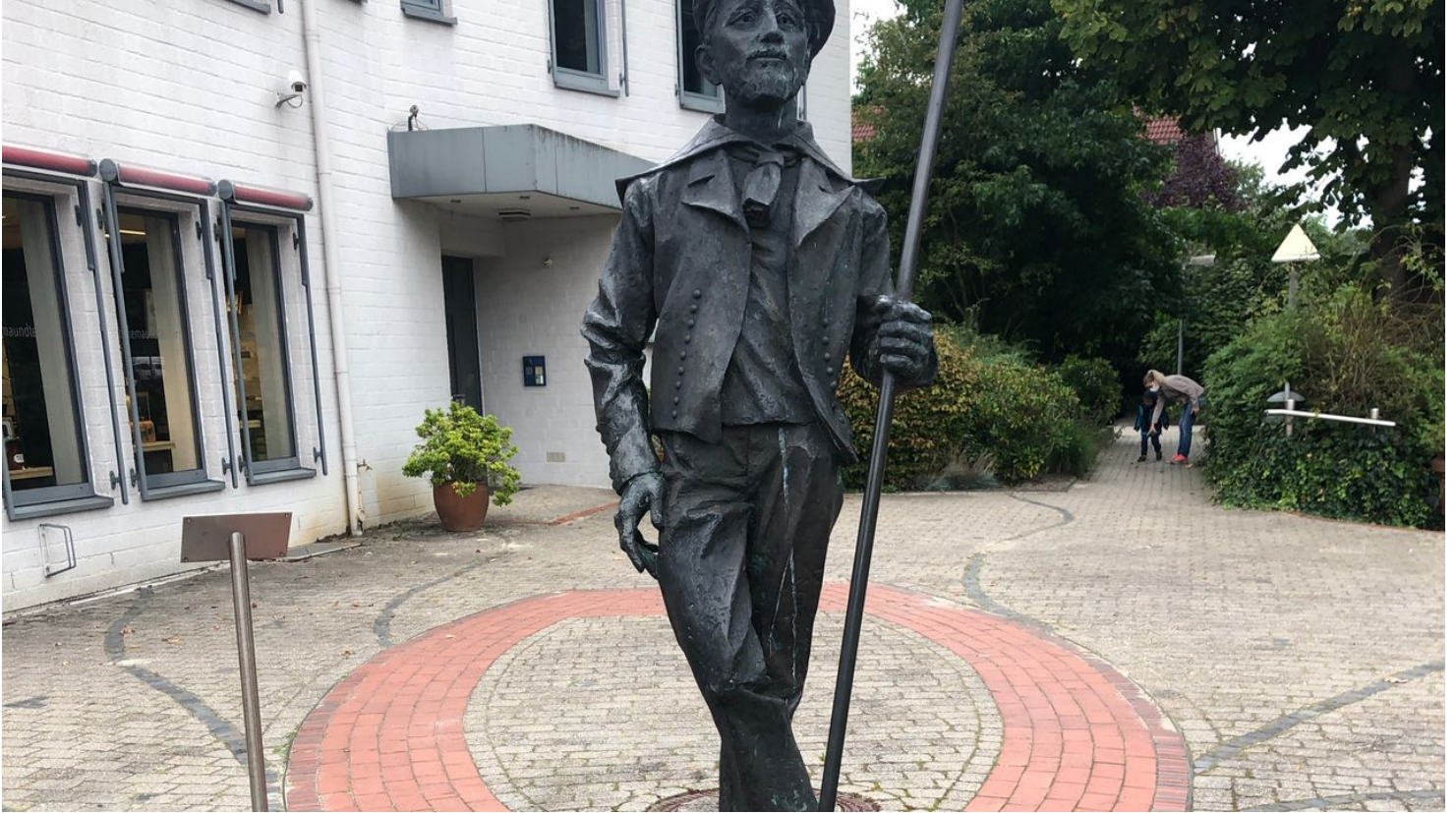
Käpt'n Kuper 2.jpeg