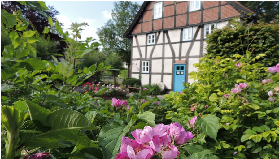
Corves Mühle - Tourist Info - © Corinna Will, Gemeinde Kalletal