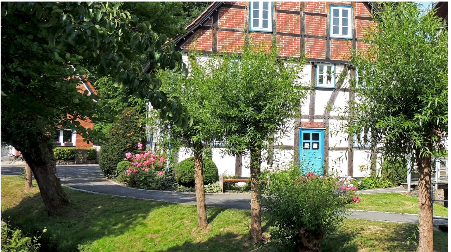
Corves Mühle an der Kalle