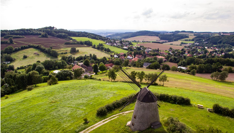
Luftaufnahme Windmühle Bavenhausen - © Robin Peste, Gemeinde Kalletal

Quelle: destination.one ID: p_100040704 Zuletzt geändert am 28.01.2024, 09:58