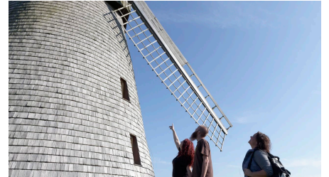
Blick auf die Mühle