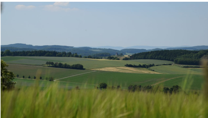
Blick aus der Ferne