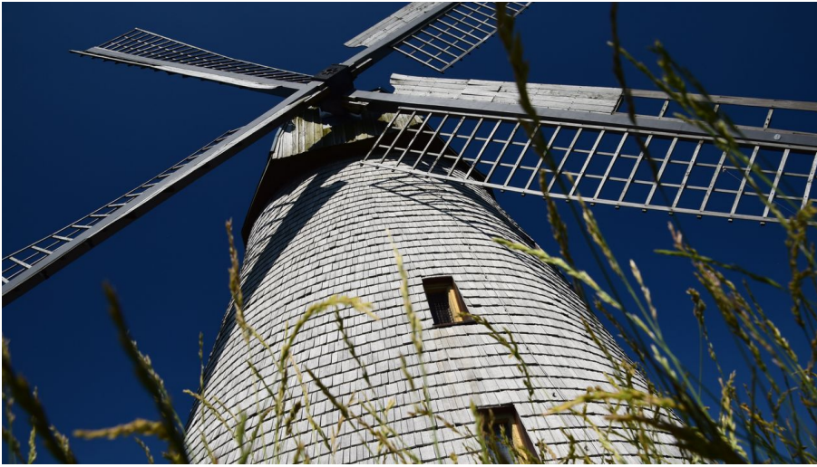
Windmühle Bavenhausen