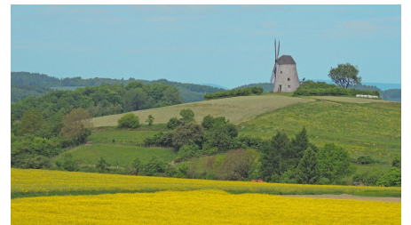
Blick auf die Mühle