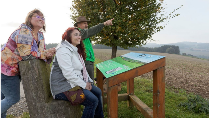
Panoramatafel mit Blick auf Talle