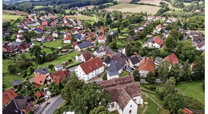
Luftaufnahme Bergdorf Talle