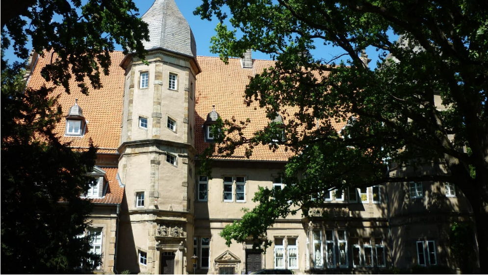
Turm Schloss Bartrup