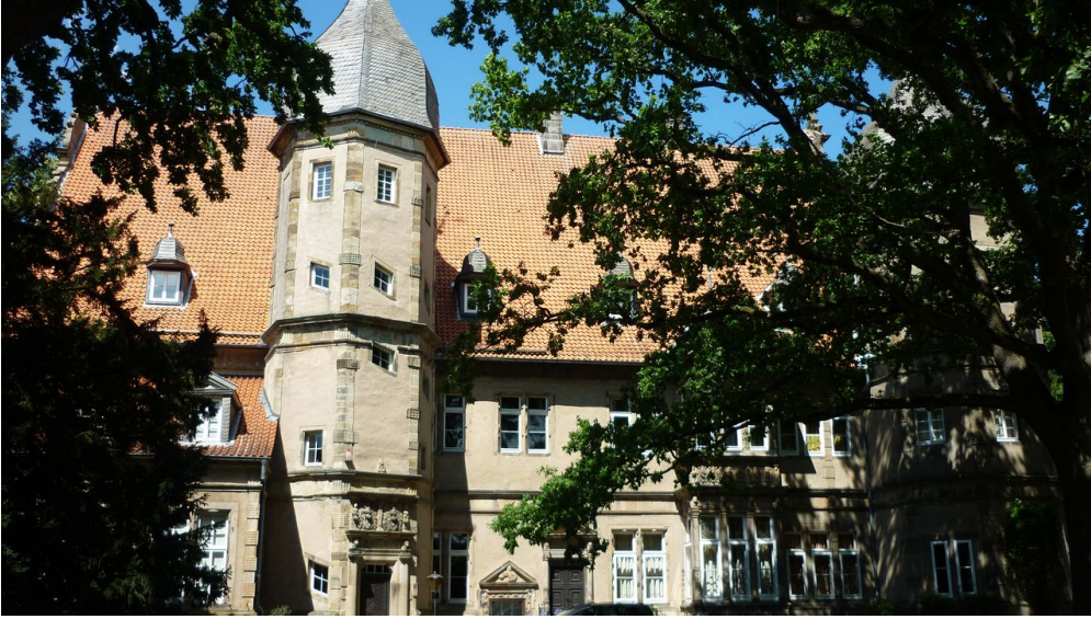
Turm Schloss Bartrup