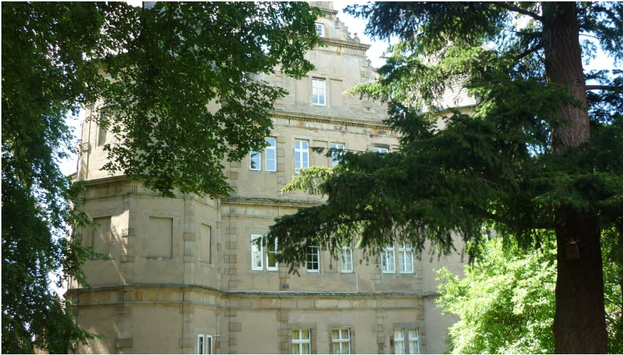
Seitenansicht Schloss Barntrup