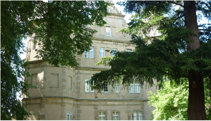
Seitenansicht Schloss Barntrup