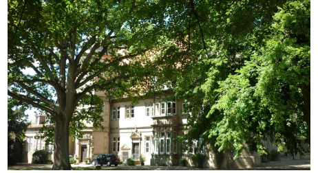
Schloss Bartrup 1