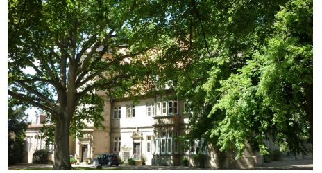
Schloss Bartrup 1