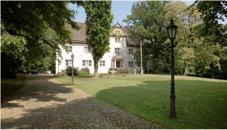
Schloss Alverdissen CC BY-SA - LTM.jpg