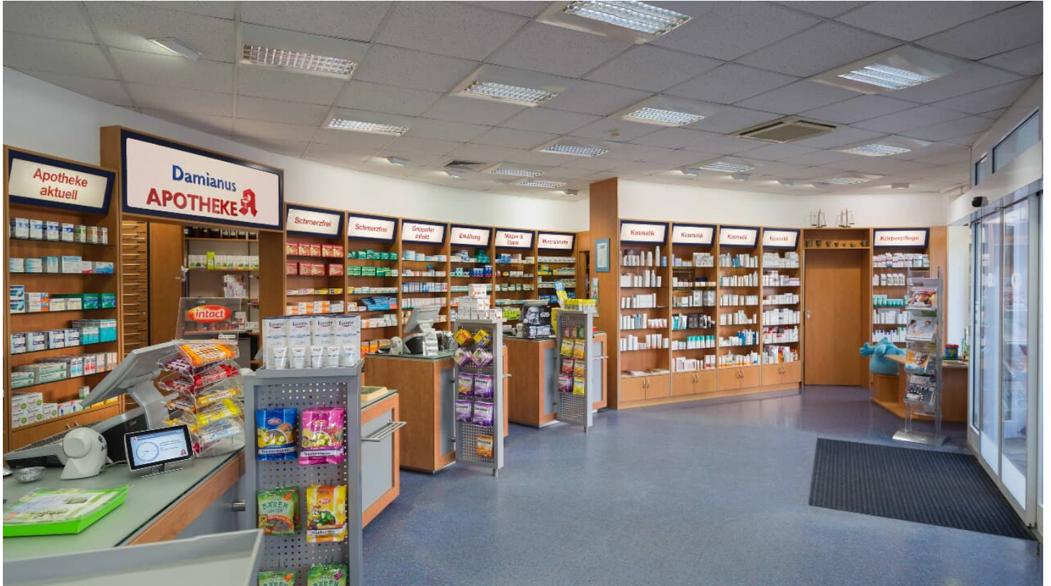
apothke-innen-rechts