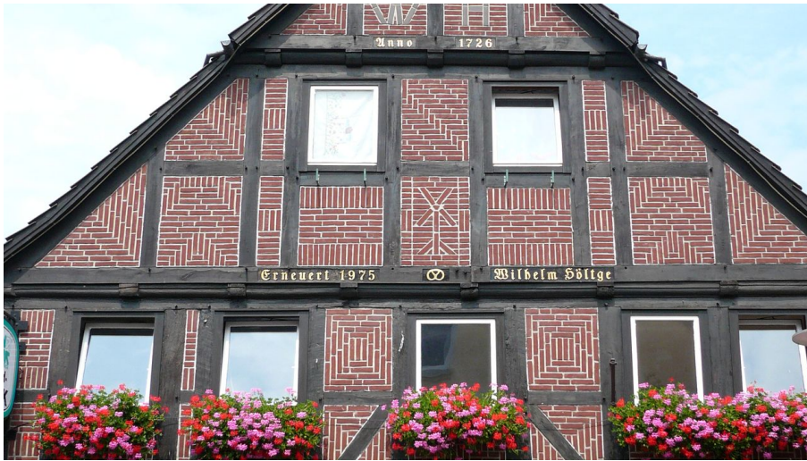
Altes Bürgerhaus in Gifhorn