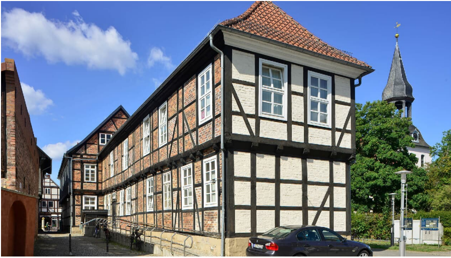
Blick auf den Langer Jammer