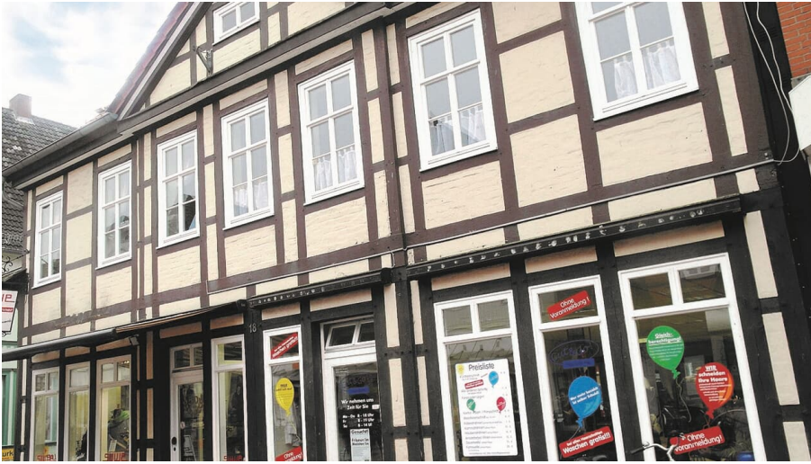
Ehemaliges Kantor- und Küsterhaus in der Gifhorer Altstadt