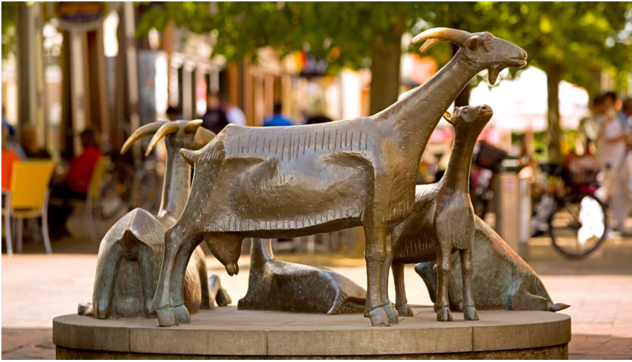
Ziegenplastik in der Gifhorner Altstadt