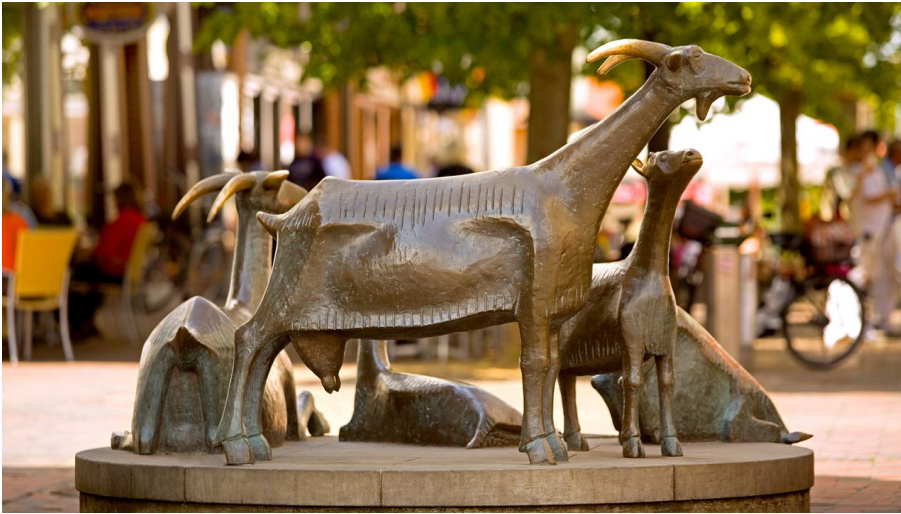
Ziegenplastik in der Gifhorner Altstadt