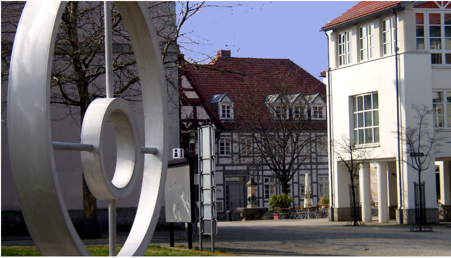
Stahlplastik hinter der St. Nicolai-Kirche