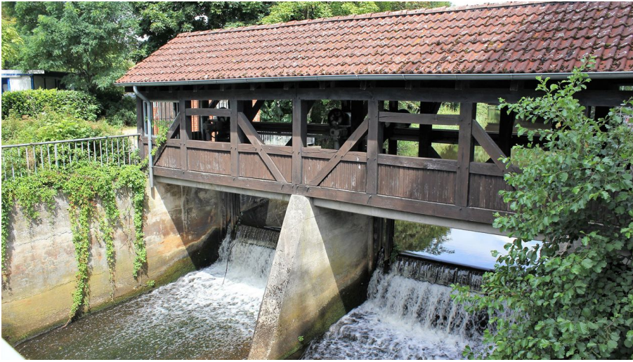
Gifhorn Cardenap-Mühle.jpg