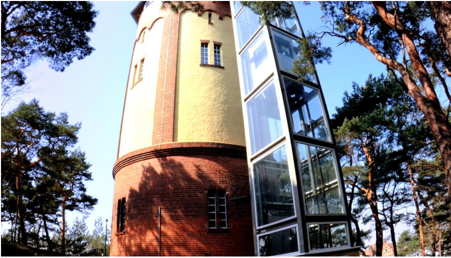
Gifhorner Wasserturm an der Braunschweiger Straße