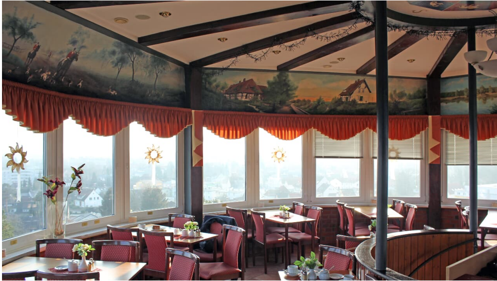
Café im Wasserturm