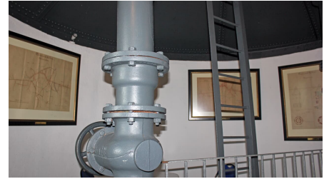
Innenbereich des Gifhorer Wasserturms