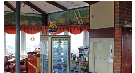
Tortenauswahl im Panoramacafé