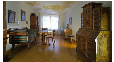
Raum für bürgerliche Wohnkultur 18.-19.Jh.