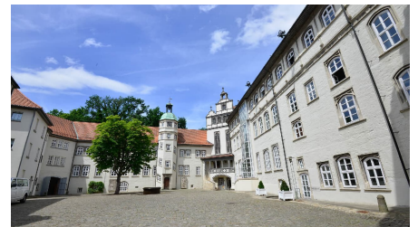
Blick in den Schlossinnenhof