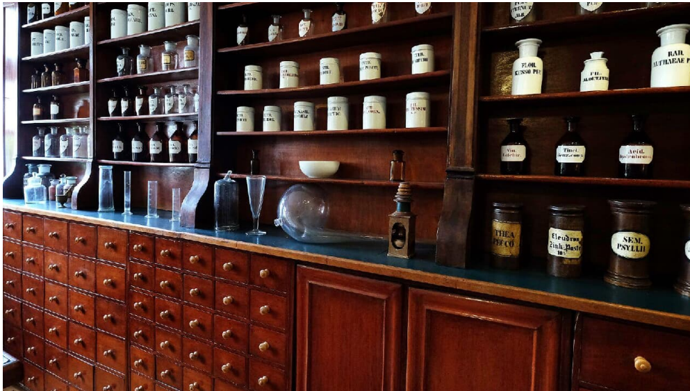
Gifhormer Schlossapotheke von 1871

Feiertage: 11:00 -17:00 Uhr Im Januar für den regulären Publikumsverkehr geschlossen. Führungen und Gruppenbesuche sind individuell nach Vereinbarung möglich.