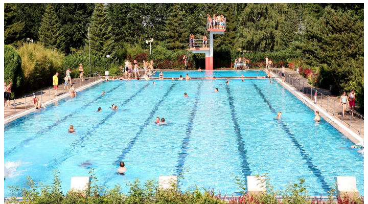
Freibad Brome