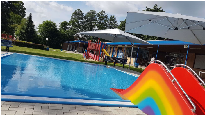
CC0 Kleinkindbecken Freibad Brome.jpg - © Samtgemeinde Brome

Uhr Sa - So 9:00 - 20:00 Uhr Letzter Einlass 19.30 Uhr