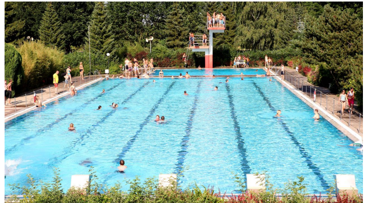
Freibad Brome