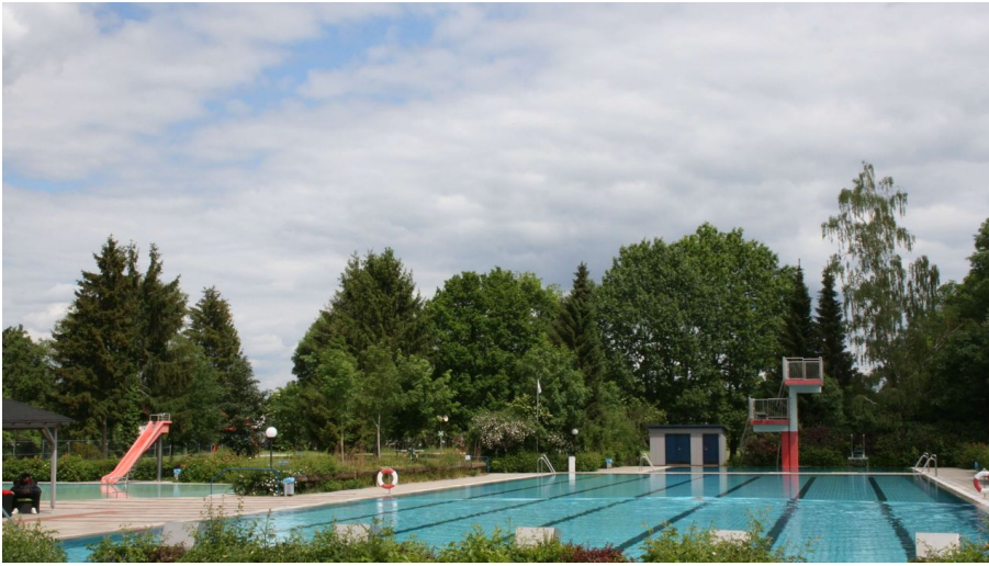
CC0 Becken Freibad Brome.jpg