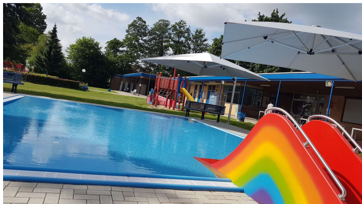
CC0 Kleinkindbecken Freibad Brome.jpg

Uhr Sa - So 9:00 - 20:00 Uhr Letzter Einlass 19.30 Uhr