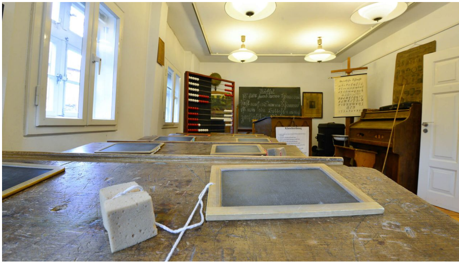
Klassenzimmer im Schulmuseum Steinhorst