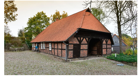
Außenansicht Schulmuseum Steinhorst