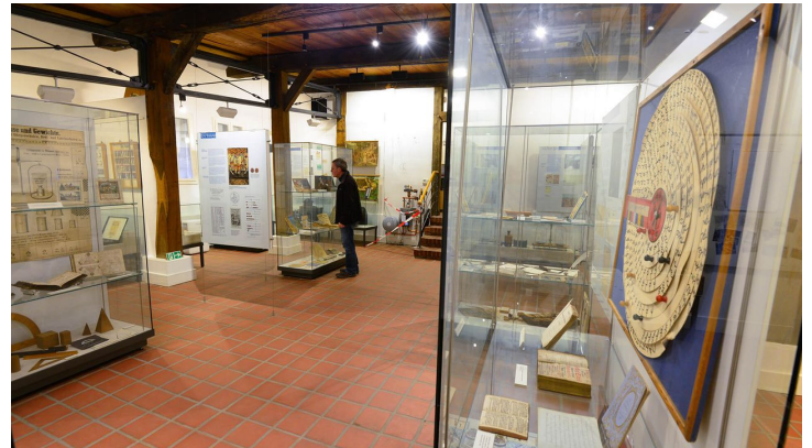
Blick eines Gastes in die Vitrine im Schulmuseum Steinhorst