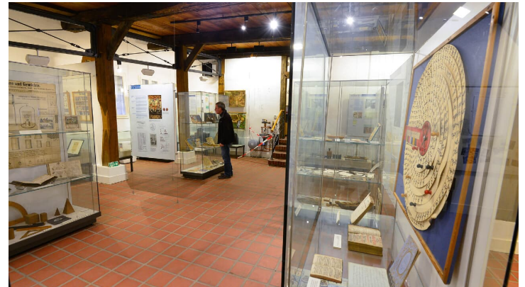
Blick eines Gastes in die Vitrine im Schulmuseum Steinhorst