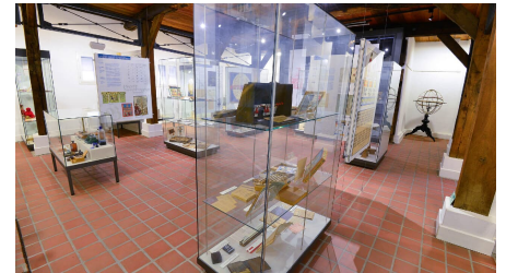
Ausstellung im Schulmuseum Steinhorst