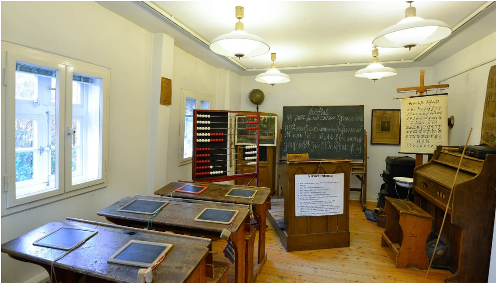
Tafel im Klassenzimmer im Schulmuseum Steinhorst in der Südheide Gifhorn