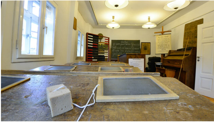
Klassenzimmer im Schulmuseum Steinhorst