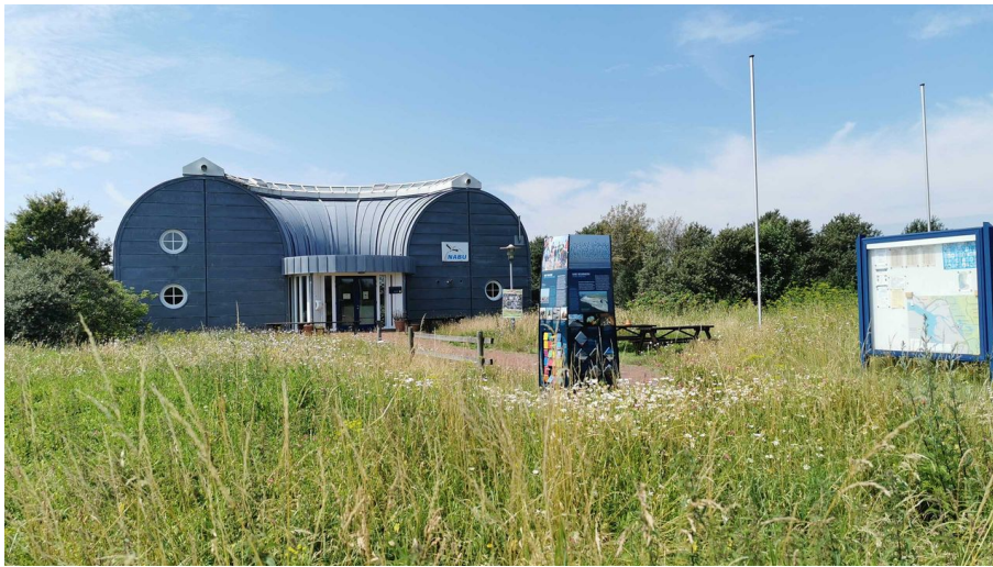
Nationalpark-Haus "Wattwurm"