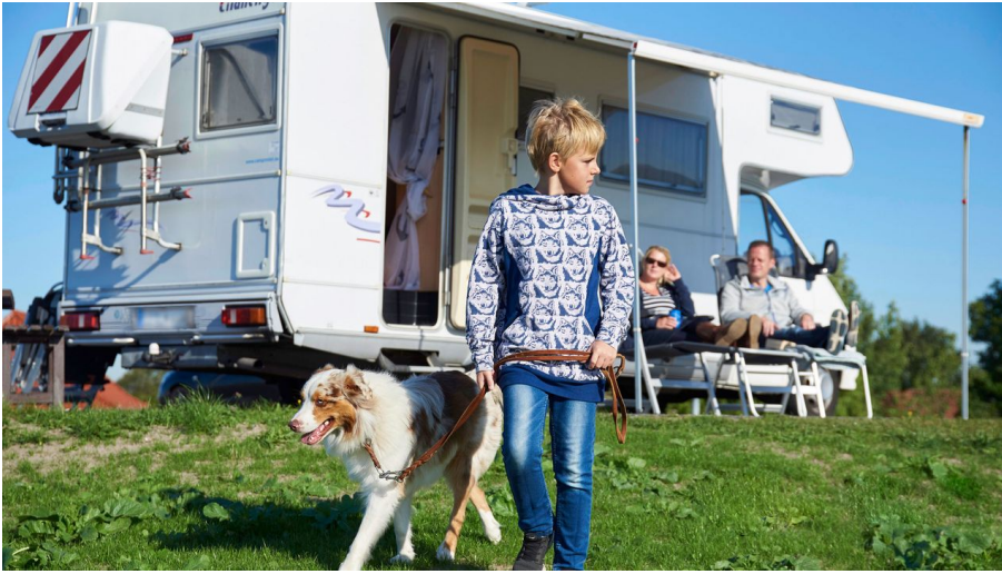
Camping in Dithmarschen (Symbolbild)