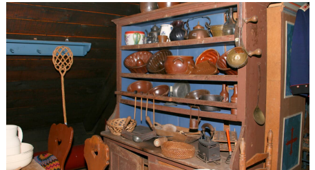
Alltagsgegenstände in der Küche