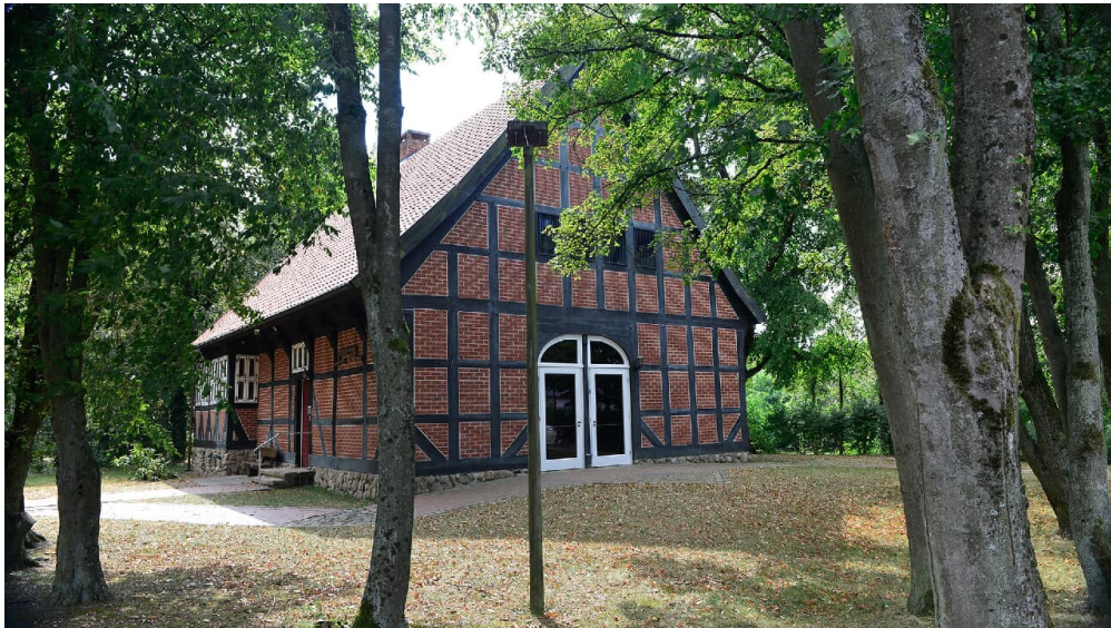
Ecke vom Junkerhof