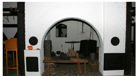
Ausstellung im Junkerhof Wittingen