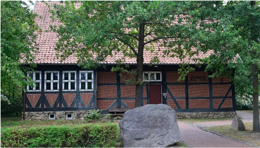
Junkerhof Wittingen