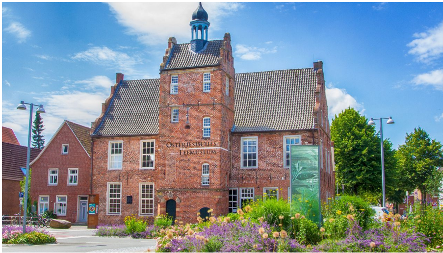
Teemuseum Norden Außenansicht.jpg