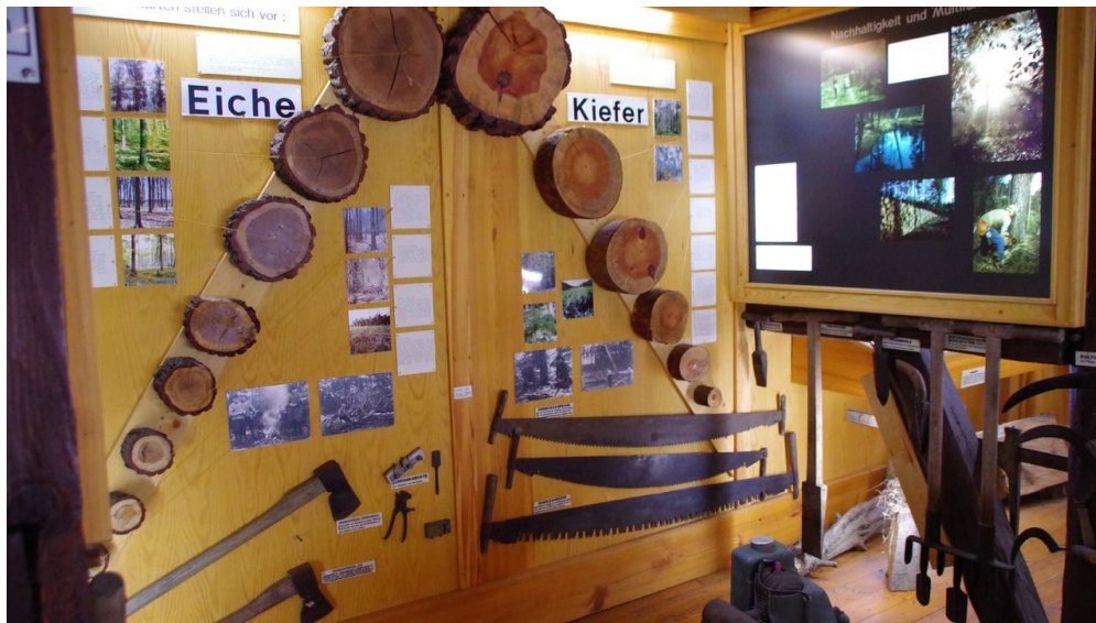
Ausstellung im Haus der Landschaft in Knesebeck