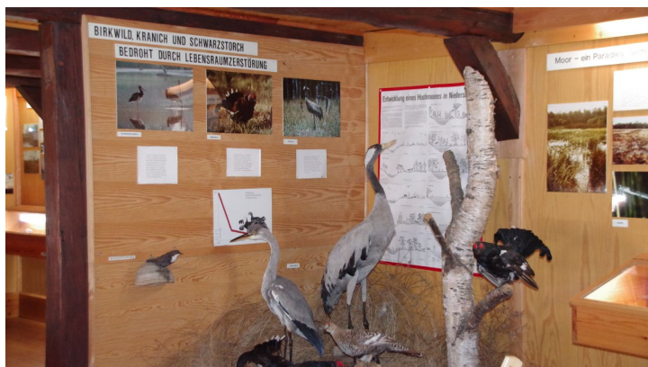
Haus der Landschaft Knesebeck Vogelausstellung