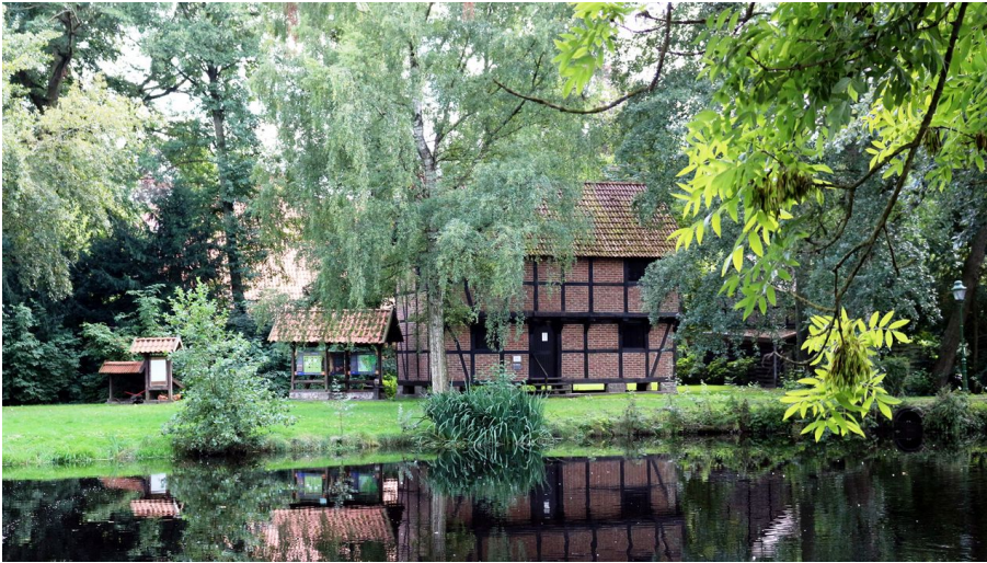
Teich am Haus der Landschaft