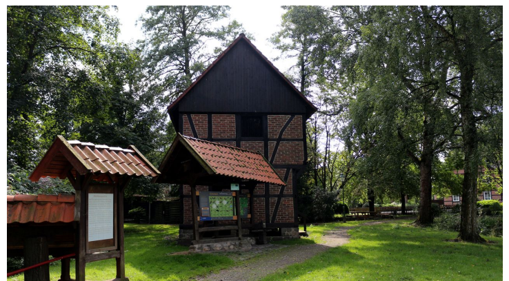
Haus der Landschaft - Hinweistafel - © Haus der Landschaft Knesebeck