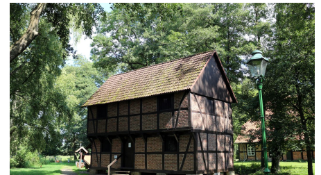
Haus der Landschaft Knesebeck