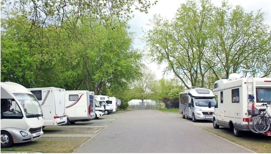
Wohnmobilstellplatz Allerwelle