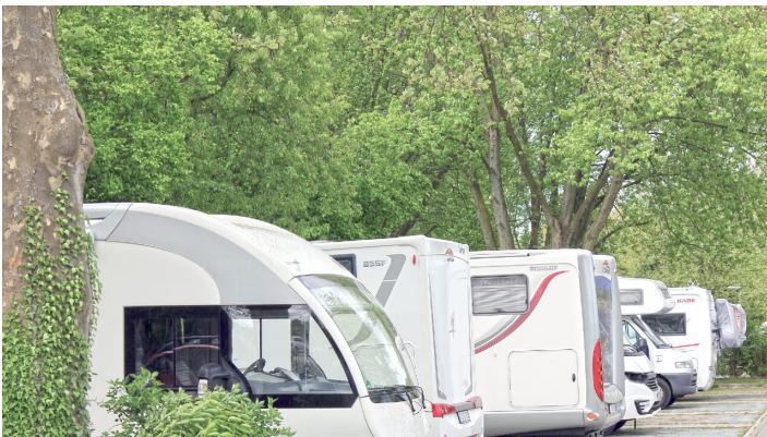
Wohnmobilstellplatz Gifhorn an der Allerwelle

10 Euro pro 24 Stunden, Strom: 1 € pro 6 Stunden und Frischwasser: 1 Euro für rund 100 Liter, Kaffeetaste (kostenfrei) ca. 2 Liter