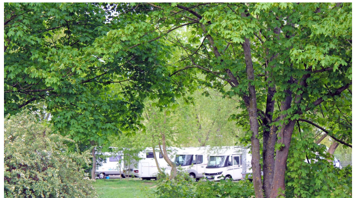
Wohnmobilstellplatz Allerwelle in Gifhorn