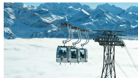
niederhorn-gondeln-winter-nebelmeer-winteraefluege