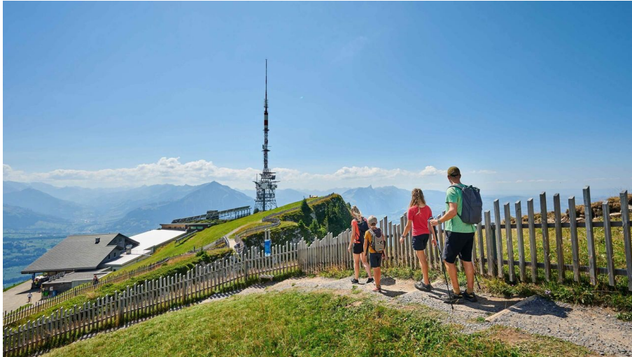
niederhorn-gratweg-sommer-familie-berghaus-antenne.jpg