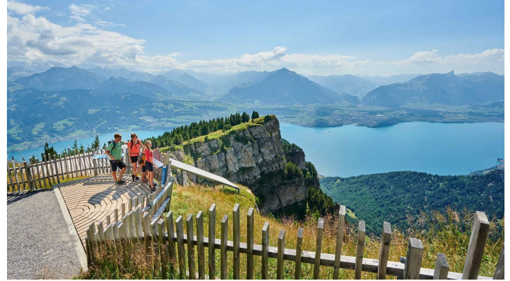
niederhorn-sonnenplateau-sommer-aussicht-thunersee-berge.jpg