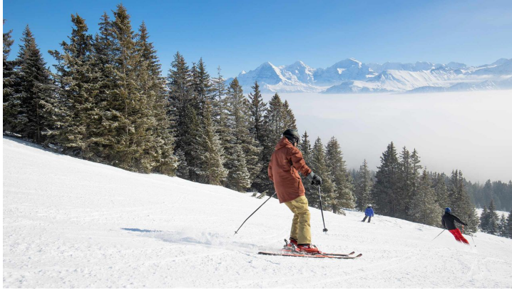
niederhorn-winter-schnee-skifahrer-tannen-nebelmeer.jpg