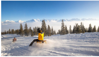
niederhorn-winter-schnee-schlitteln-pulverschnee- nebelmeer.jpg