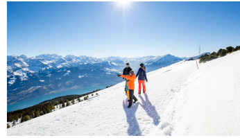
niederhorn-winter-schnee-wandern-familie- thunersee.jpg