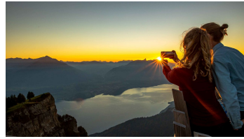
niederhorn-sommer-sonnenuntergang-foto- aussicht.jpg