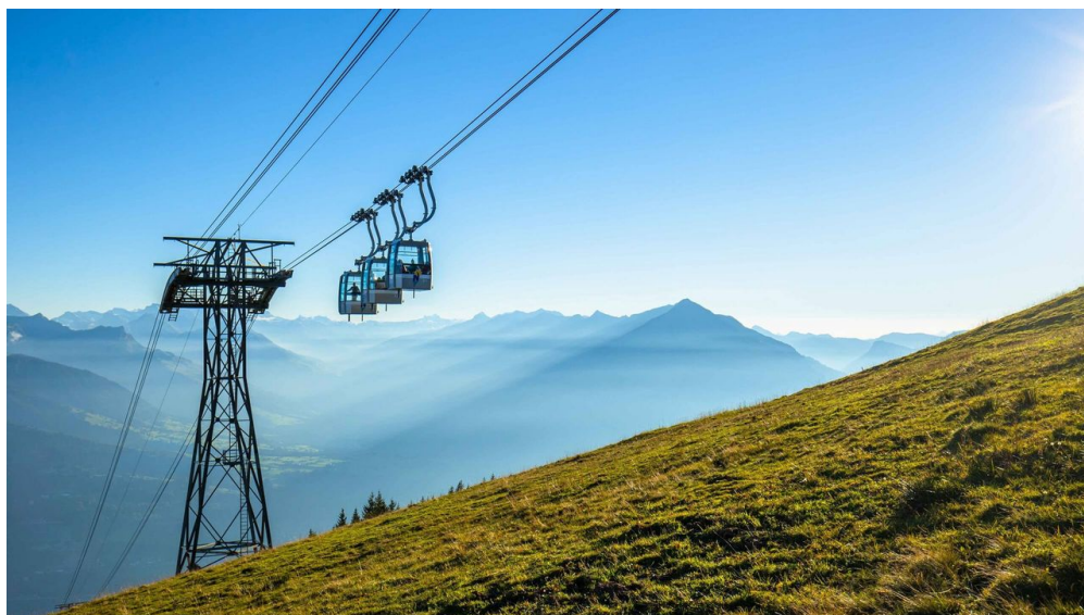
niederhorn-gondeln-niesen-landschaft.jpg