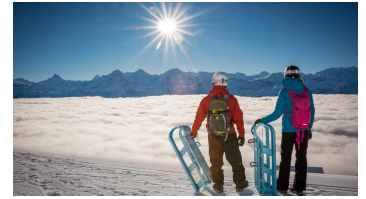
niederhorn-schlitteln-winter-nebelmeer- aussicht