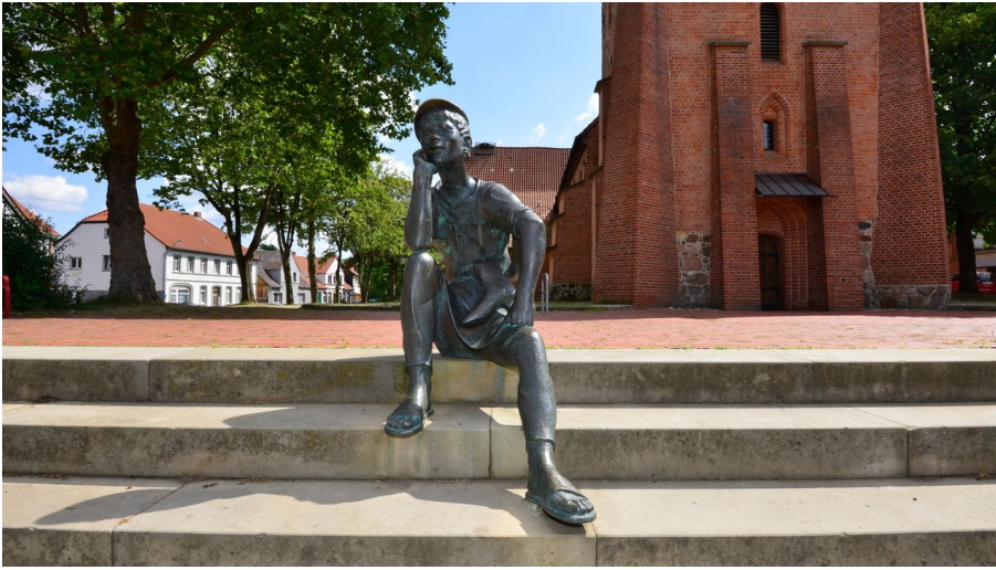
Schusterjunge vor der St. Stephanus Kirche