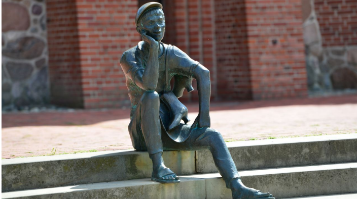
Schusterjunge am Marktplatz in Wittingen - © Südheide Gifhorn GmbH/Frank Bierstedt