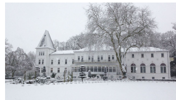
altes-kurhaus-im-schnee.jpg