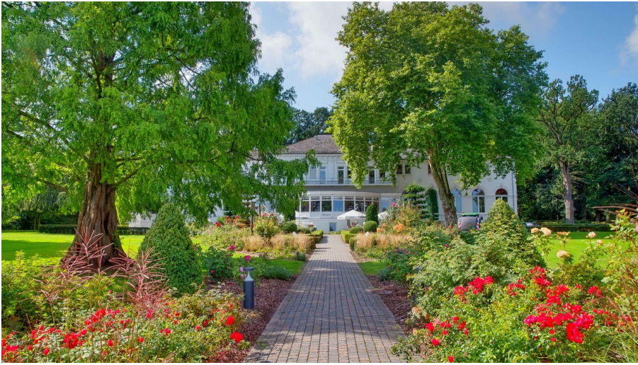
Altes-kurhaus-rosengarten