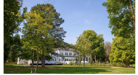
altes-kurhaus-sommer.jpg