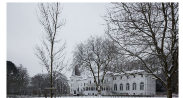
altes-kurhaus-schnee