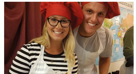
Funky Chocolate Club, Interlaken Tourismus - web@interlaketourism.ch