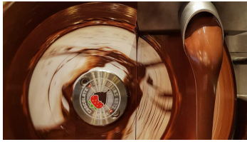
Funky Chocolate Club, Interlaken Tourismus - web@interlaketourism.ch