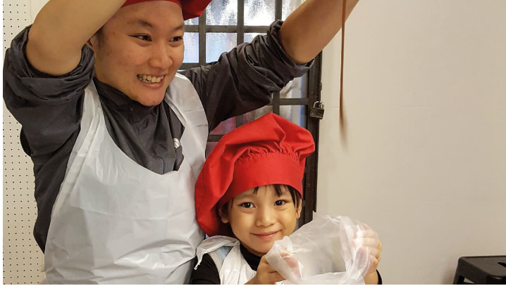
Funky Chocolate Club