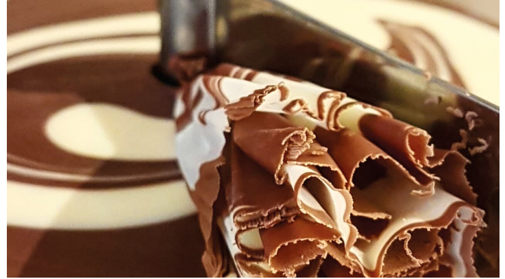
Funky Chocolate Club