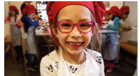
Funky Chocolate Club, Interlaken Tourismus - web@interlaketourism.ch