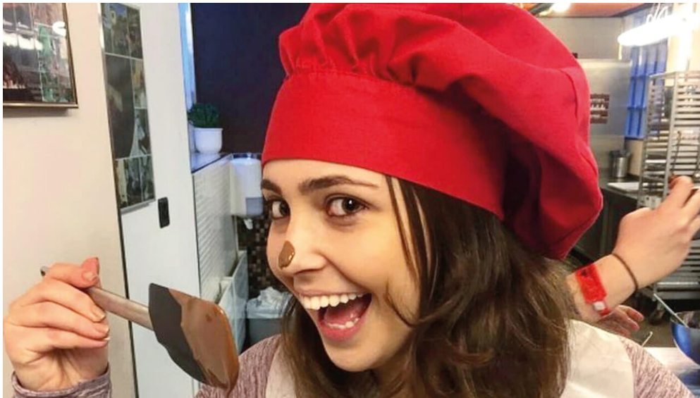
Funky Chocolate Club

Montag, 26.02.2024, 10:00 - 19:00 Uhr Mittwoch, 28.02.2024, 12:00 - 19:00 Uhr Donnerstag, 29.02.2024, 12:00 - 19:00 Uhr Freitag, 01.03.2024, 12:00 - 21:00 Uhr Samstag, 02.03.2024, 12:00 - 21:00 Uhr Sonntag, 03.03.2024, 12:00 - 19:00 Uhr Montag, 04.03.2024, 10:00 - 19:00 Uhr Mittwoch, 06.03.2024, 12:00 - 19:00 Uhr Donnerstag, 07.03.2024, 12:00 - 19:00 Uhr Freitag, 08.03.2024, 12:00 - 21:00 Uhr Samstag, 09.03.2024, 12:00 - 21:00 Uhr Sonntag, 10.03.2024, 12:00 - 19:00 Uhr Montag, 11.03.2024, 10:00 - 19:00 Uhr Mittwoch, 13.03.2024, 12:00 - 19:00 Uhr Donnerstag, 14.03.2024, 12:00 - 19:00 Uhr Freitag, 15.03.2024, 12:00 - 21:00 Uhr Samstag, 16.03.2024, 12:00 - 21:00 Uhr Sonntag, 17.03.2024, 12:00 - 19:00 Uhr Montag, 18.03.2024, 10:00 - 19:00 Uhr Mittwoch, 20.03.2024, 12:00 - 19:00 Uhr [...]