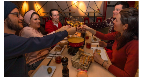
niederhorn-sternschlitteln-fondue-nachtessen-gertraenke