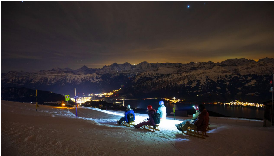
niederhorn-sternenschlitteln-schnee-nacht-panorama