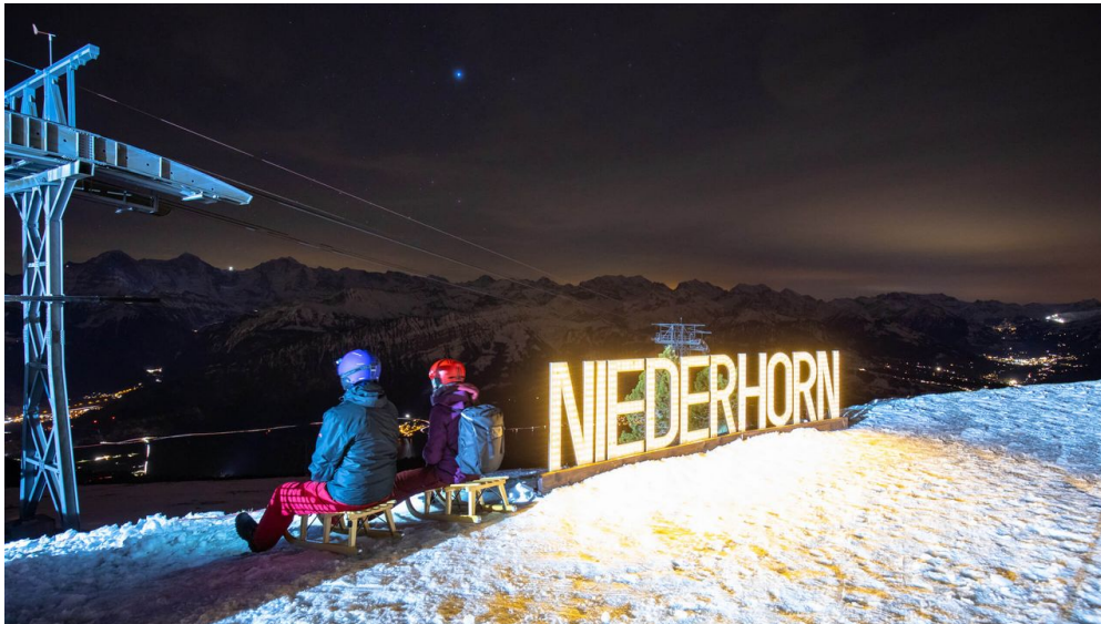
niederhorn-sternschlitteln-schrift-nacht-schnee

22. Dezember 2023 – 10. März 2024, jeweils Freitag und Samstagabend