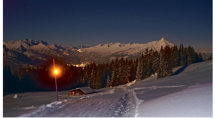
niederhorn-schlitteln-winter-nacht-abendstimmung-sterne-schlittelweg