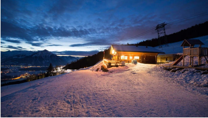
niederhorn-schlitteln-winter-abendstimmung-wolken-vorsass-lichter