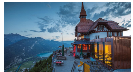
Jungfraubahnen AG, Interlaken Tourismus - web@interlaketourism.ch