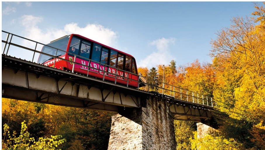
Jungfrauabahn AG, Interlaken Tourismus - web@interlaketourism.ch