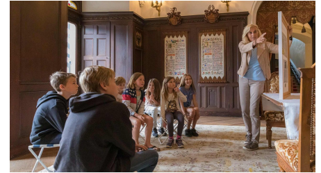
Schloss Oberhofen