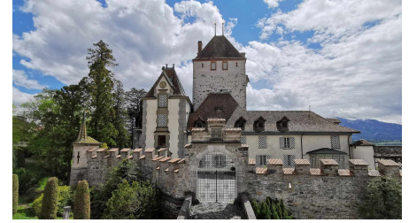
Schloss Oberhofen