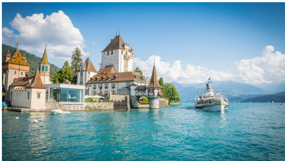
Tourismus-Organisation Interlaken, Interlaken Tourismus - web@interlaketourism.ch

musées serrures Bâtiments historiques parcs / jardins été