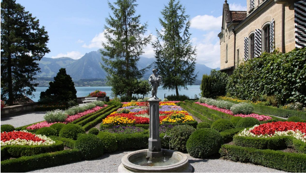
Schloss Oberhofen