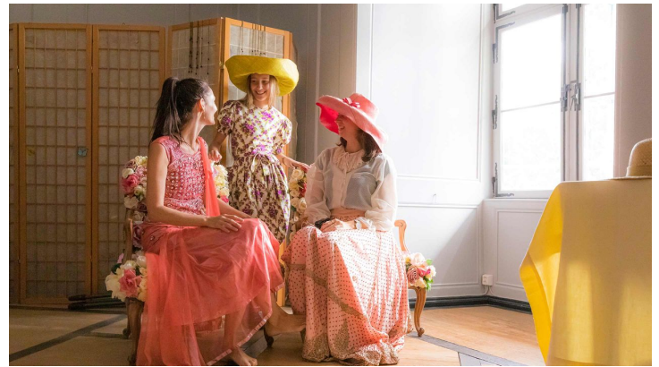
Schloss Oberhofen, Interlaken Tourismus - web@interlaketourism.ch