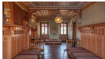
Schloss Oberhofen