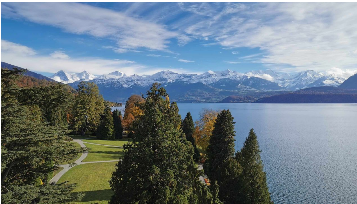
Schloss Oberhofen