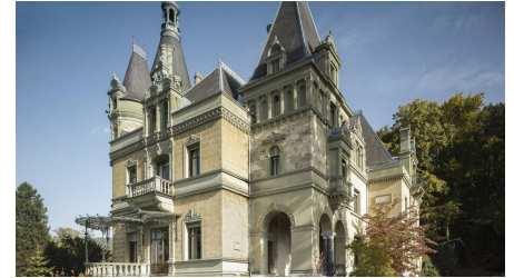
hilterfingen-schloss-huenegg-herbst-aussenansicht