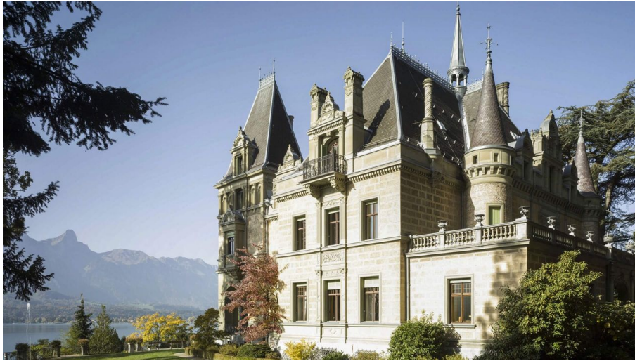
hilterfingen-schloss-huenegg-panorama

Museen | Schlösser | Historische Bauten | Parks/Gärten | Sommer