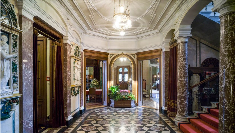
hilterfingen-schloss-huenegg-museum-eingang-treppe

Mitte Oktober bis zum Muttertag geschlossen Saison 2024: Sonntag, 12. Mai bis Sonntag, 20. Oktober offen Museum & Schlosscafé: Dienstag – Samstag 14 – 17 Uhr, Sonn- & Feiertage 11 – 17 Uhr Brocante Royal: Samstag 14 – 17 Uhr & Sonntag 11 – 17 Uhr