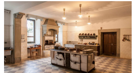
hilterfingen-schloss-huenegg-museum-kueche