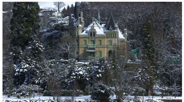
hilterfingen-schloss-huenegg-winter-aussenansicht-thunersee-schloesser