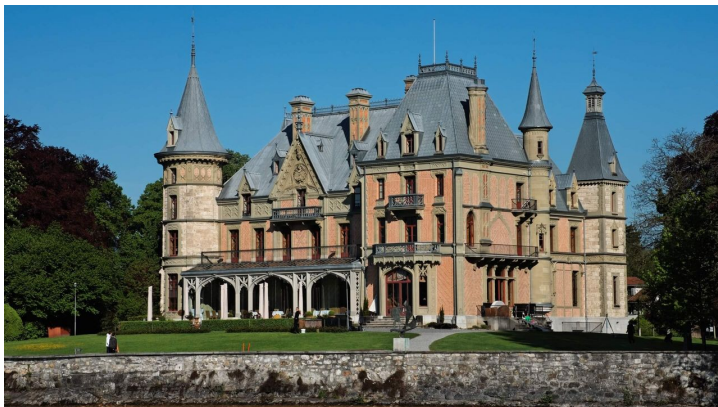
thun-schloss-schadau-thunersee