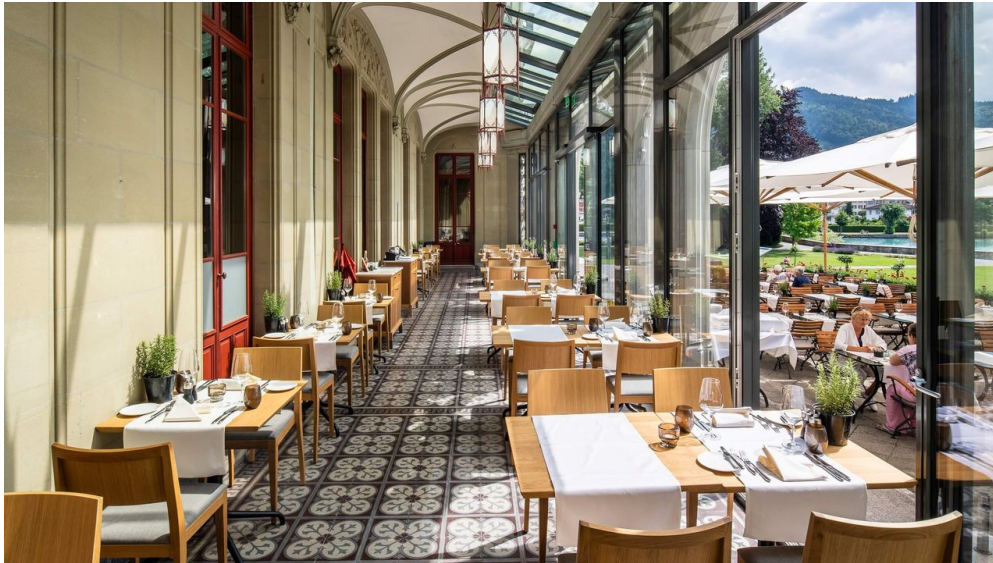
thun-schloss-schadau-sommer-veranda

Donnerstag, 15.08.2024, 08:30 - 23:30 Uhr [...]