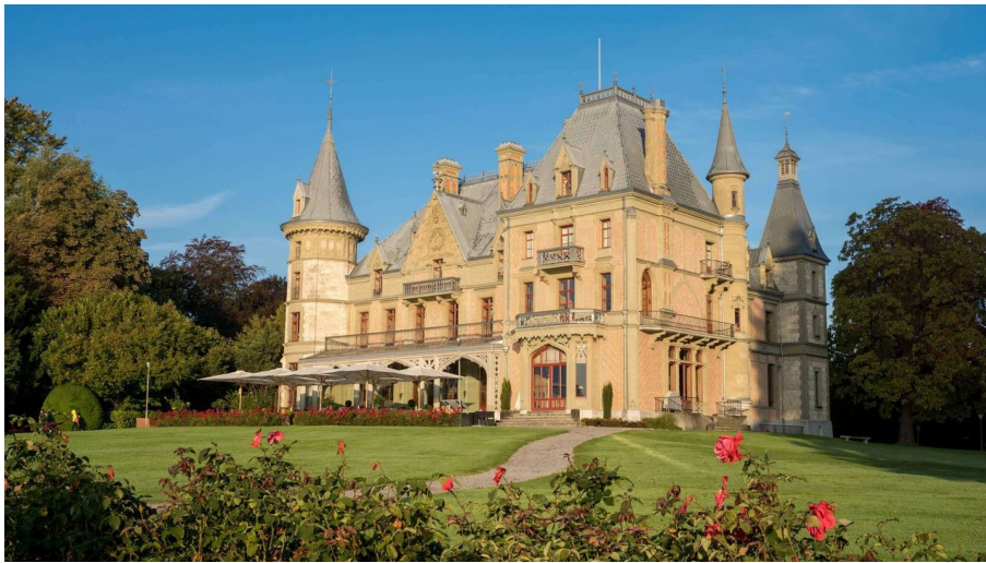
thun-schloss-schadau-sommer-aussenansicht-garten-thunersee-schloesser