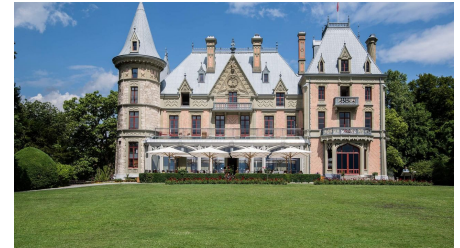
thun-schloss-schadau-aussenaufnahme-sommer