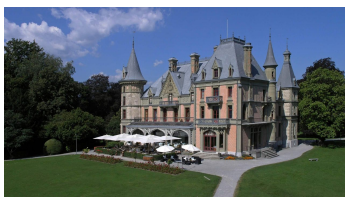
thun-schloss-schadau-sommer-aussenansicht-schadaupark