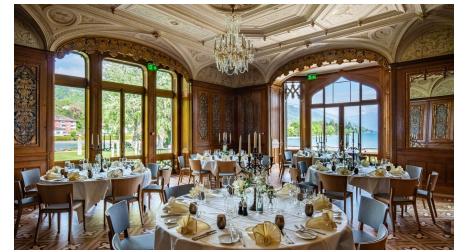
thun-schloss-schadau-saal-rougemont