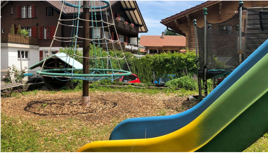
Aire de jeux avec toboggan, carrousel et trampoline

aires de jeu pour enfants / aires de jeu d'eau