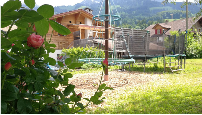
Carrusel et trampoline à l'aire de jeux du restaurant Hirschen Oey

Dernière modification le 19.03.2024, 14:52