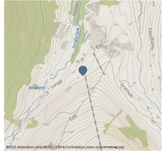
©2022 destination.one | ©2022 OSM & Contributors (www.openstreetmap.org)