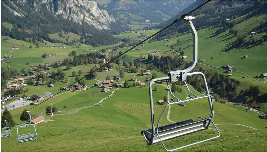
diemtigtal-grimmialp-sessellift-sommer