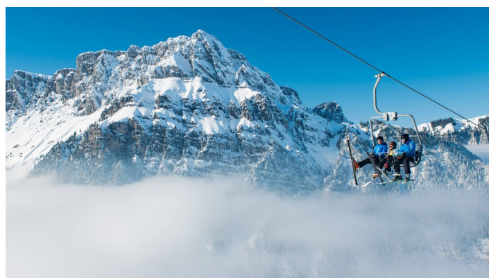
dientigtal-grimmialp-winter-skifahren-sessellift-nebel-winteraktivitaeten