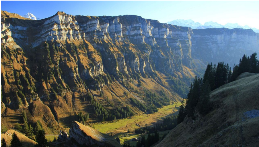
Interlaken Tourismus - web@interlaketourismus.ch