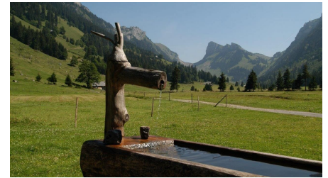
Interlaken Tourismus - web@interlakentourism.ch