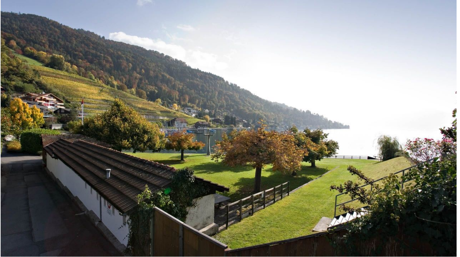
Strandbad Oberhofen, Interlaken Tourismus - web@interlaketourism.ch