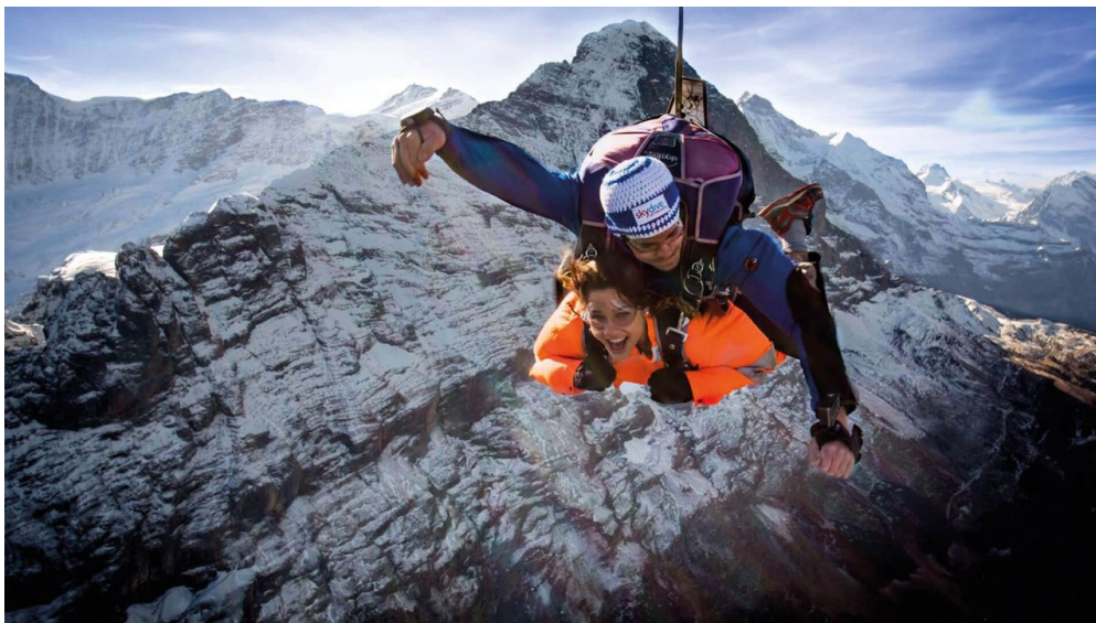
Skydive Interlaken

Samstag, 27.07.2024, 08:00 - 18:00 Uhr Sonntag, 28.07.2024, 08:00 - 18:00 Uhr Montag, 29.07.2024, 08:00 - 18:00 Uhr Dienstag, 30.07.2024, 08:00 - 18:00 Uhr Mittwoch, 31.07.2024, 08:00 - 18:00 Uhr Donnerstag, 01.08.2024, 08:00 - 18:00 Uhr Freitag, 02.08.2024, 08:00 - 18:00 Uhr Samstag, 03.08.2024, 08:00 - 18:00 Uhr Sonntag, 04.08.2024, 08:00 - 18:00 Uhr Montag, 05.08.2024, 08:00 - 18:00 Uhr Dienstag, 06.08.2024, 08:00 - 18:00 Uhr Mittwoch, 07.08.2024, 08:00 - 18:00 Uhr Donnerstag, 08.08.2024, 08:00 - 18:00 Uhr Freitag, 09.08.2024, 08:00 - 18:00 Uhr Samstag, 10.08.2024, 08:00 - 18:00 Uhr Sonntag, 11.08.2024, 08:00 - 18:00 Uhr Montag, 12.08.2024, 08:00 - 18:00 Uhr Dienstag, 13.08.2024, 08:00 - 18:00 Uhr Mittwoch, 14.08.2024, 08:00 - 18:00 Uhr Donnerstag, 15.08.2024, 08:00 - 18:00 Uhr [...]