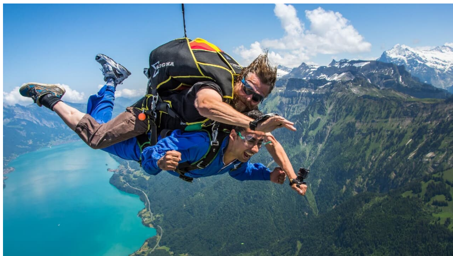
Skydive Interlaken, Interlaken Tourismus - web@interlaketourism.ch