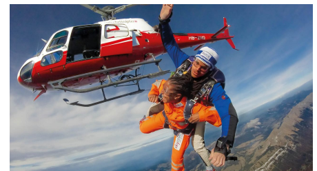
Skydive Interlaken, Interlaken Tourismus - web@interlaketourism.ch