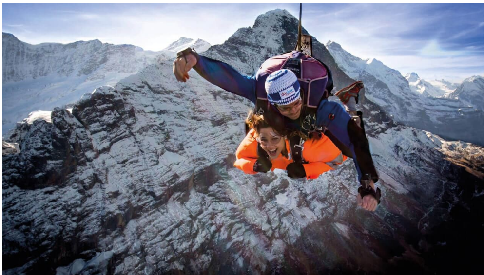
Skydive Interlaken, Interlaken Tourismus - web@interlaketourism.ch

Montag, 26.02.2024, 08:00 - 18:00 Uhr Dienstag, 27.02.2024, 08:00 - 18:00 Uhr Mittwoch, 28.02.2024, 08:00 - 18:00 Uhr Donnerstag, 29.02.2024, 08:00 - 18:00 Uhr Freitag, 01.03.2024, 08:00 - 18:00 Uhr Samstag, 02.03.2024, 08:00 - 18:00 Uhr Sonntag, 03.03.2024, 08:00 - 18:00 Uhr Montag, 04.03.2024, 08:00 - 18:00 Uhr Dienstag, 05.03.2024, 08:00 - 18:00 Uhr Mittwoch, 06.03.2024, 08:00 - 18:00 Uhr Donnerstag, 07.03.2024, 08:00 - 18:00 Uhr Freitag, 08.03.2024, 08:00 - 18:00 Uhr Samstag, 09.03.2024, 08:00 - 18:00 Uhr Sonntag, 10.03.2024, 08:00 - 18:00 Uhr Montag, 11.03.2024, 08:00 - 18:00 Uhr Dienstag, 12.03.2024, 08:00 - 18:00 Uhr Mittwoch, 13.03.2024, 08:00 - 18:00 Uhr Donnerstag, 14.03.2024, 08:00 - 18:00 Uhr Freitag, 15.03.2024, 08:00 - 18:00 Uhr Samstag, 16.03.2024, 08:00 - 18:00 Uhr [...]