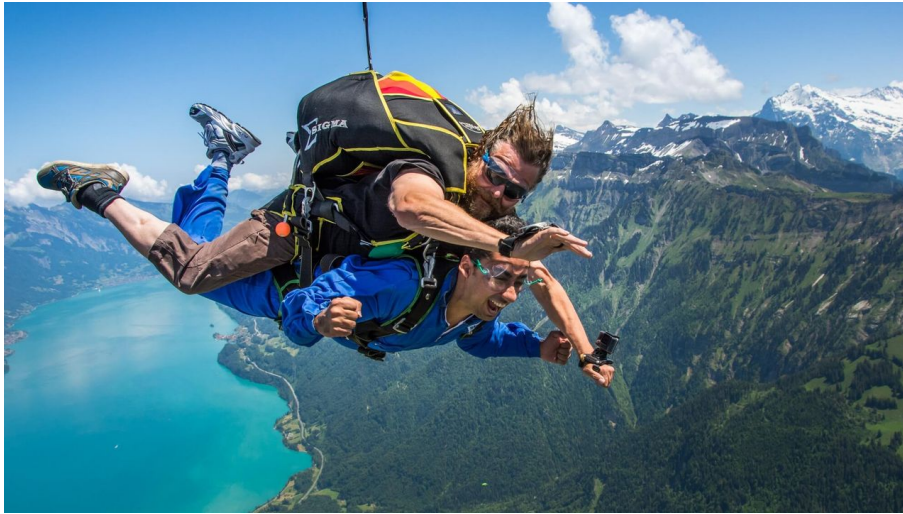
Skydive Interlaken, Interlaken Tourismus - web@interlaketourism.ch